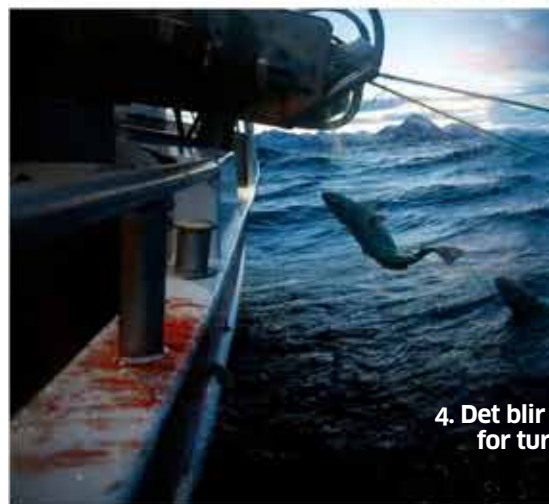
4. Det blir for tur