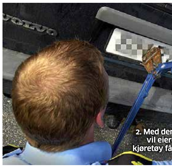
2. Med den vil eier kjøretøy få

1990 til 2025 kroner. Når du har hatt utgifter hos fysioterapi, for rehabilitering o.a. som overstiger taket, får du automatisk frikort.