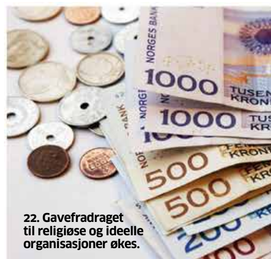
22. Gavefradraget til religiøse og ideelle organisasjoner økes.

11 Egenandels-taket øker Du må betale 53 kroner mer hos lege før du får frikort i 2018. Egandelsgrensen heves fra 2205 til 2258 kroner. Når utgifter til lege, psykolog, poliklinikk, røntgen, laboratorieprøver m.m. overstiger grensen, får man automatisk frikort. Du må betale 35 kroner mer før du når egenandelstak 2. Taket foreslås hevet fra